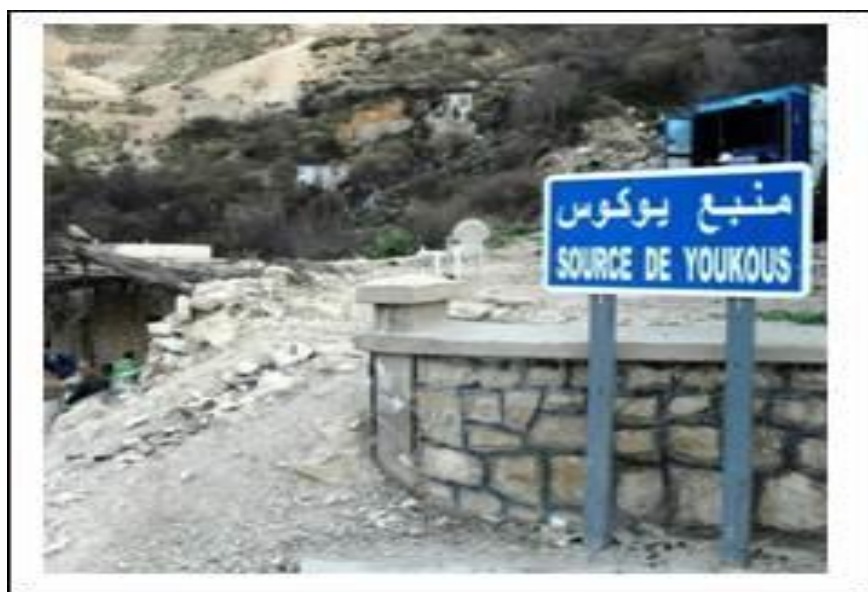
Hammamet, anciennement Youks-les-Bains